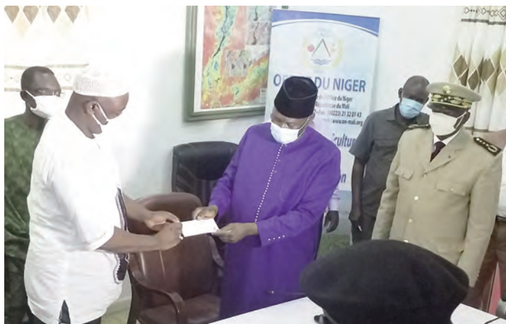
Cette contribution des travailleurs de l'Office du Niger, est destinée à la commission nationale de lutte contre la Covid 19

Il a profité de l'occasion pour vivement remercier la Direction générale de l'Office du Niger sous la férule du PDG