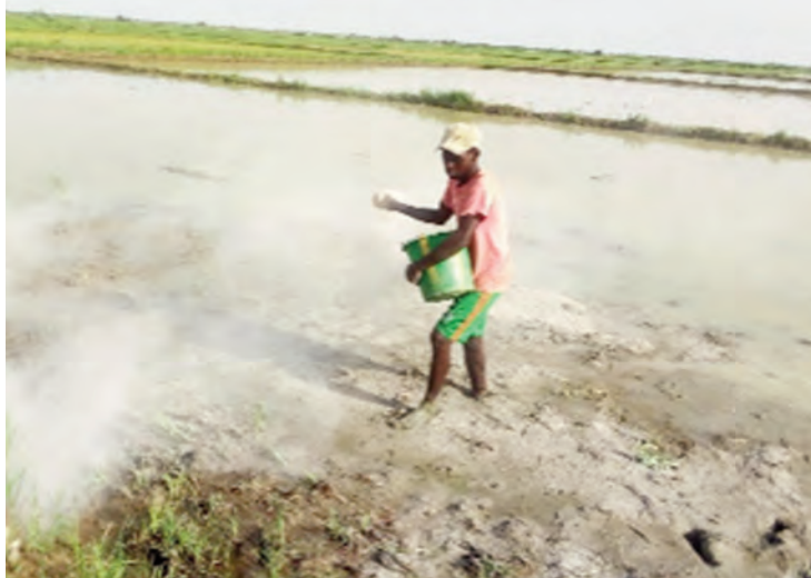
Le rendement dans toutes les parcelles tests a été supérieur à celui des parcelles témoins

L'analyse des résultats obtenus a permis de noter une nette amélioration du pH dans toutes les parcelles tests (T1). Le nombre de tiges de plants des parcelles tests (T1) ainsi que leur croissance végétative se sont révélés nettement supérieurs à ceux des plants des parcelles témoins (T0). Un rendement moyen de 5,63 t/ha a été obtenu au niveau des parcelles tests. Ce qui est nettement supérieur à celui des parcel-