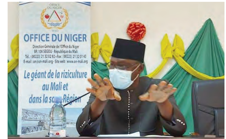
L'opération doit déboucher sur la lisibilité effective des actes de gestion posés

- Procéder à une revue limitée des états financiers de l'Office du Niger au titre des trois derniers exercices (2017, 2018 et 2019) afin de mettre en évidence les dysfonctionnements, les erreurs et les anomalies ; - Faire un examen critique des procédures administratives, financières et comptables et porter un jugement cri-